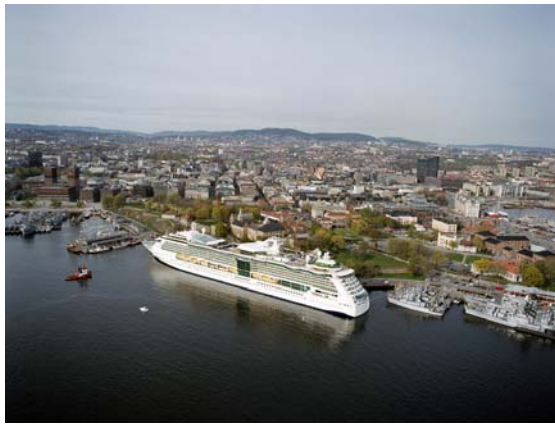
RCCLs Jewel of the Seas i Oslo i april 2004